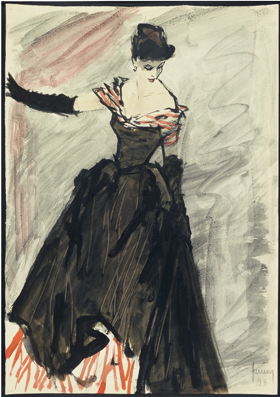
Gerd Grimm, 1946