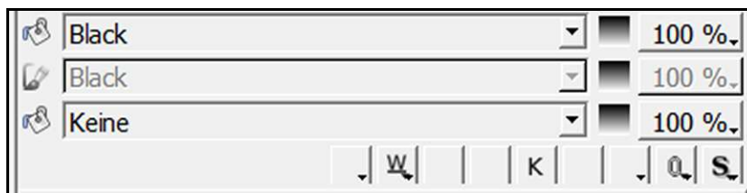
Das Register «Farben und Effekte»

In den Aufklappmenüs wählen Sie die Farbe der Zeichen und der Zeichenumrisse aus. Hier können Sie auch den Tonwert festlegen.